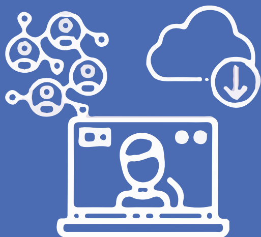
APRENDIZAJE ONLINE INTERACTIVO