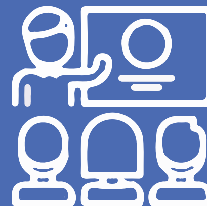
SESIONES DE COACHING A EQUIPOS ESCOLARES