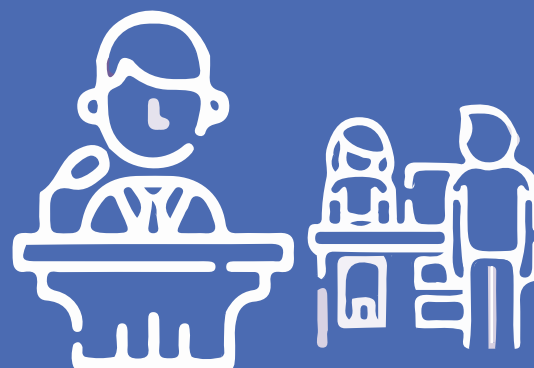
SESIONES EN VIVO